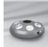
Osyrion 6 Akku-Licht Ø 30-50 mm