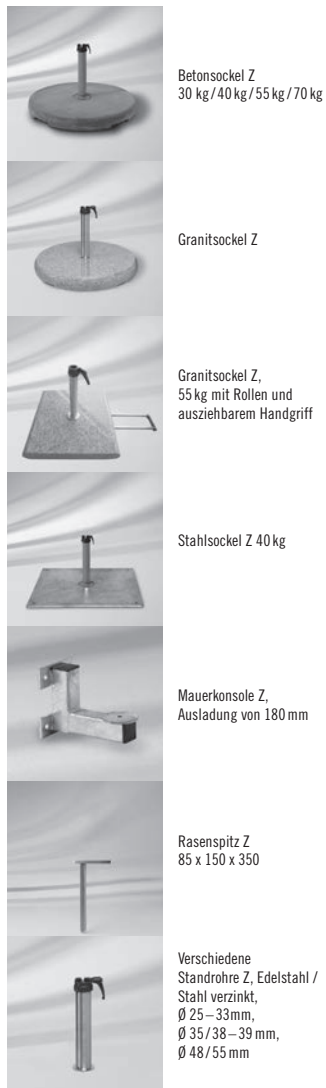
Betonsockel Z 30 kg / 40 kg / 55 kg / 70 kg