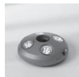
Osyrion 4 Akku-Licht Ø 30 - 50 mm