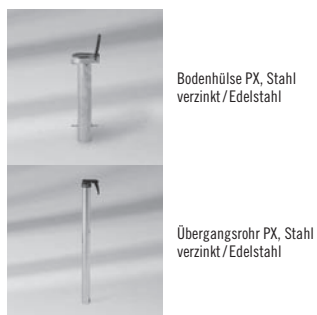
Bodenhülse PX, Stahl verzinkt / Edelstahl