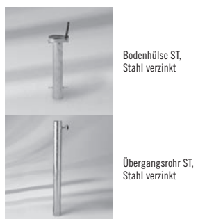
Bodenhülse ST, Stahl verzinkt