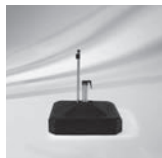
Rollensockel, eckig, 100 kg