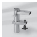
Bride U für Tischblatt