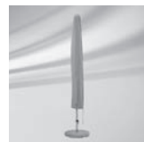
Schutzhülle mit Stab und Reissverschluss