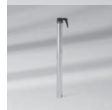
Übergangrohr PX, Stahl verzinkt/ Edelstahl