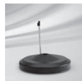
Rollensockel M4, rund, 150 kg