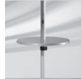
Bistrotisch Ø 48/55 mm