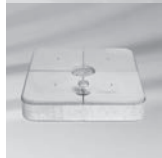
Rollensockel M4, 150 kg