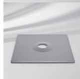
Abdeckung zu Sockel M4