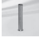
Standrohr Z, P+, Edelstahl / Stahl verzinkt