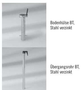
Bodenhülse BT, Stahl verzinkt