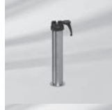
Standrohr Z, Edelstahl / Stahl verzinkt Ø 48/55 mm