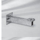
Mauerkonsole M4, Ausladung von 480 mm