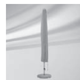
Schutzhülle / Schutzhülle mit Stab und Reissverschluss