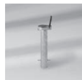
Bodenhülse PX, Stahl verzinkt/Edelstahl