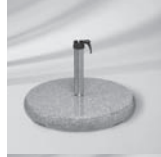
Granitsockel Z, 90 kg