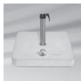
Rollensockel Z, 55 kg/90 kg