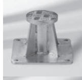
Montageplatte M4, spezial, Aufbauhöhe 150–350 mm, Stahl verzinkt