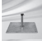
Stahlsockel Z 40 kg