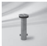
Bodenhülse M4, Stahl verzinkt