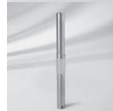
Übergangrohr PX, P+, Stahl verzinkt/ Edelstahl