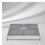
Sockel M4, 120 kg, 180 kg, 240 kg, Stahl verzinkt

(Standrohr oder Aufstellschirm zwingend notwendig)