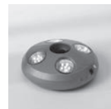
Osyrion 4 Akku-Licht Ø 30-50 mm