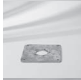
Montageplatte M4, M8, Stahl verzinkt