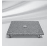
Granitsockel M4, 120 kg, Naturstein mit Rollen