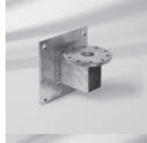
Mauerkonsole M4, Ausladung von 100 mm