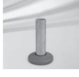
Standrohr P+ für FORTELLO® / LED und PENDALEX® P+