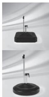
Rollensockel, eckig, 45 kg