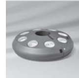
Osyrion 8 Akku-Licht Ø 48-68 mm