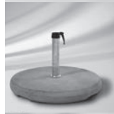
Betonsockel Z 70 kg/90 kg