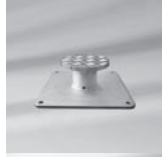
Montageplatte M4, spezial, Aufbauhöhe 50–149 mm, Stahl verzinkt