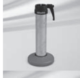
Verschiedene Standrohre M4, Stahl verzinkt