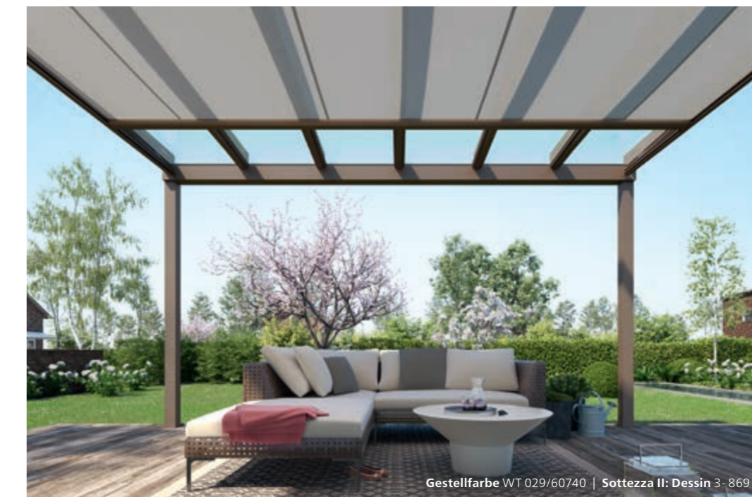
Gestellfarbe WT 029/60740 | Sottezza II: Dessin 3-869

Beim Terrazza Pure VertiPlus ist die Senkrecht-Markise so clever in das Glas-Terrassendach integriert, dass keine Übergänge, Kanten oder Aufsätze zu sehen sind. Alles ist perfekt aufeinander abgestimmt – technisch und optisch.