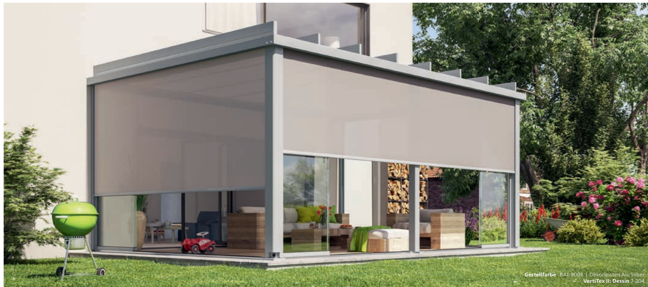
Gestellfarbe RAL 9006 | Dekorleisten Alu Silber VertiTex II: Dessin 7-204

Sie möchten von den Seiten und von vorne vor Blicken und blendendem Licht geschützt sein? Dann ist die Senkrecht-Markise VertiTex II von weinor die richtige Wahl. Die speziell für VertiTex II entwickelte Kollektion screens by weinor® umfasst eine große Auswahl an hochwertigen Tüchern. Und das patentierte weinor Opti-Flow-System® gewährleistet einen optimalen Tuchstand. VertiTex II für Terrazza Pure gibt es demnächst auch in der optisch attraktiven VertiPlus-Variante.